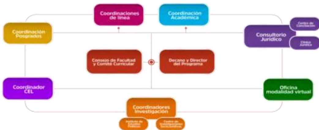
Fuente: Programa de derecho

Dentro de la oferta académica de la Universidad se encuentra la Facultad de Ciencias Jurídicas y Políticas que ofrece el programa de derecho, el cual viene siendo uno de los programas líderes de la Universidad desde 1972, cuya estructura orgánica es la siguiente: