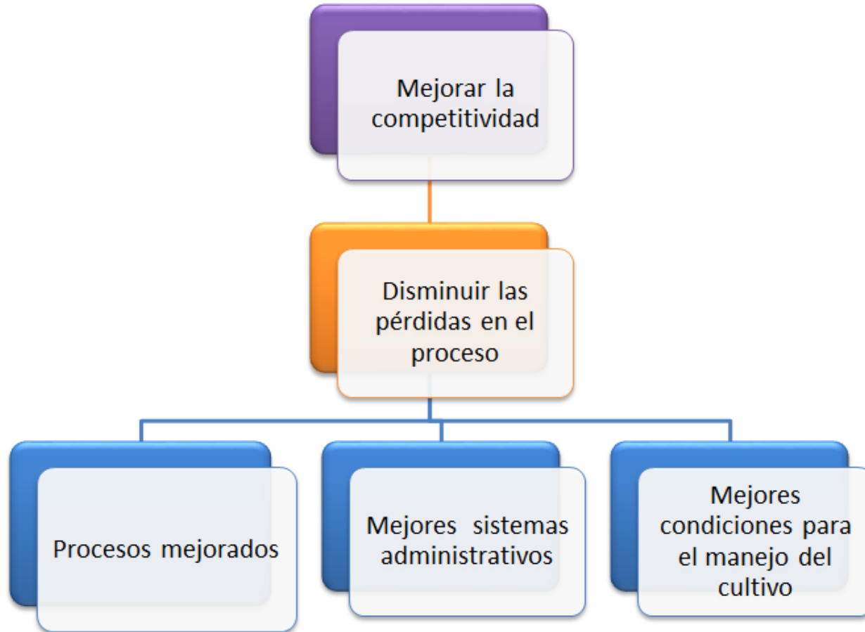
Figura 4: Árbol de objetivos