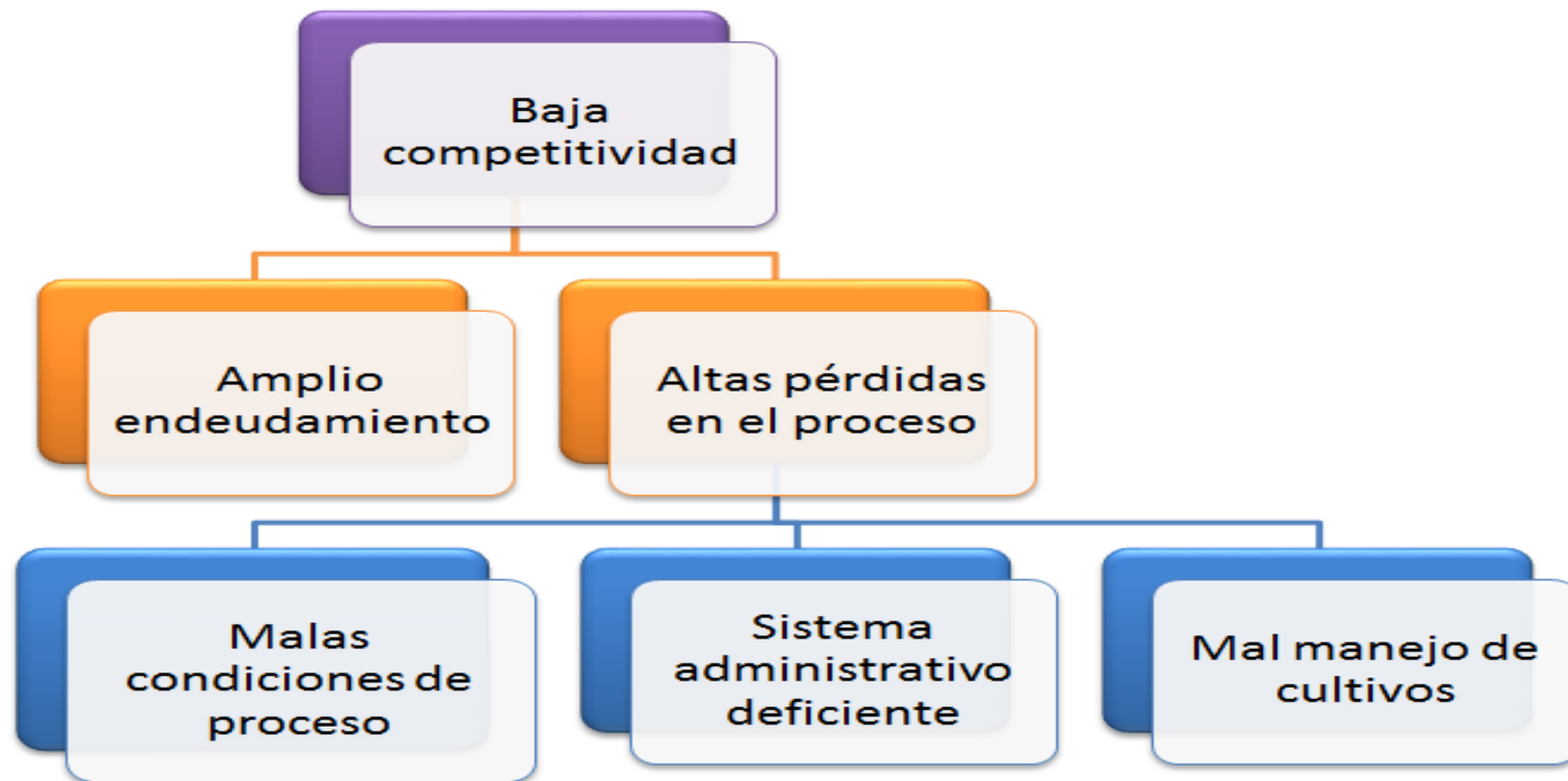
Figura 2 : ARBOL DE PROBLEMAS