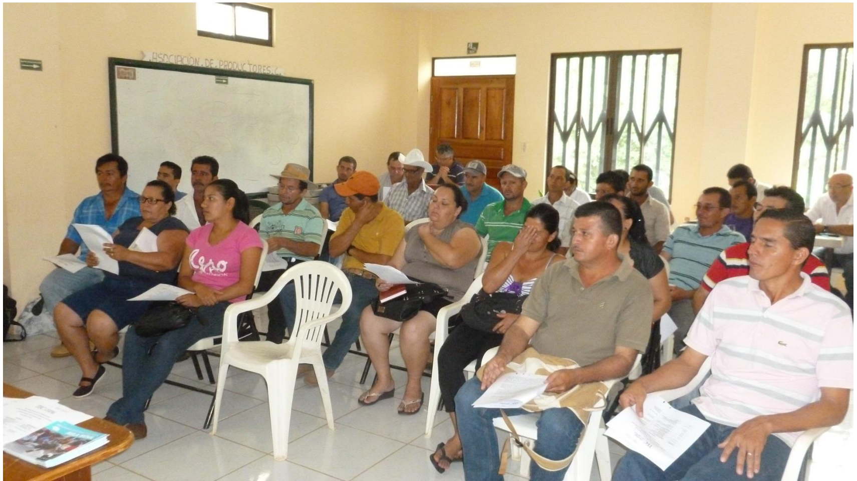
Figura 1: Participantes en I Taller: Identificación de problemas