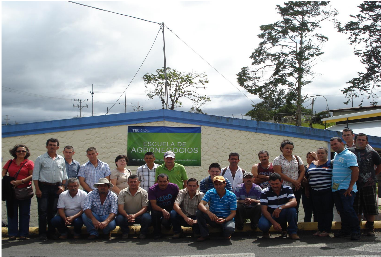
Figura 2: Beneficiarios del proyecto Asociaciones de productores de granos Región Brunca