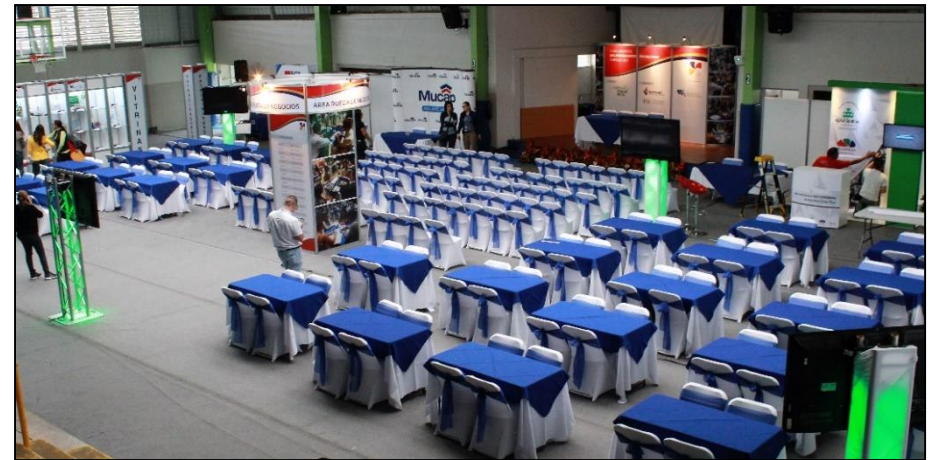
Sede del III Encuentro de Encadenamientos Productivos